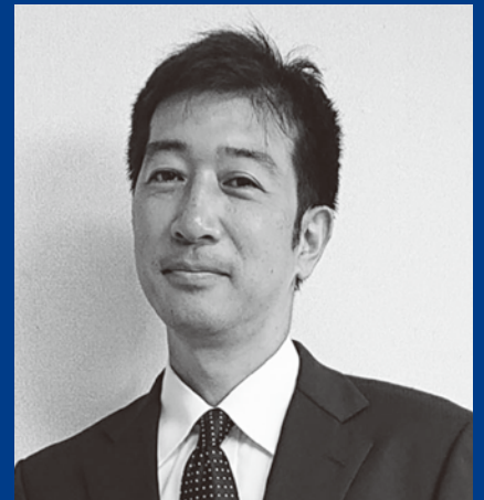
ラボテック株式会社 研究所 副所長