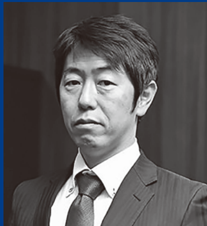
クリエイティブ・エージェント株式会社 代表取締役