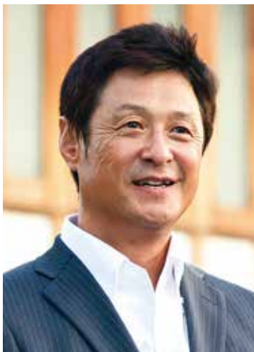
パネラー 広島西経営研究会会長 サンタクロース スクールジャパン株式会社 代表取締役