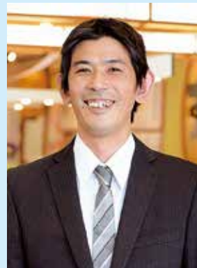
コーディネーター 鮮コーポレーション株式会社 すし部門次長