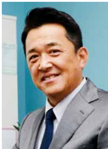
パネラー 広島西経営研究会次期会長 株式会社ニムラ 代表取締役