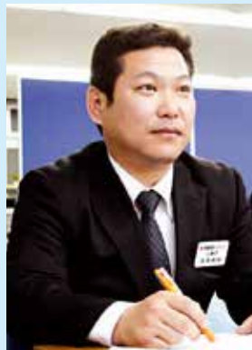
コーディネーター 株式会社ウエストヒル 代表取締役